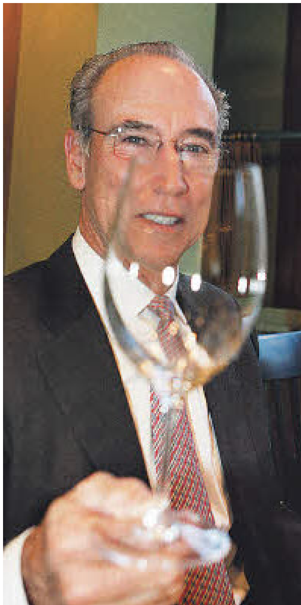
Dienstagmorgen: Mondavi trinkt Wein erst ab 10 Uhr...